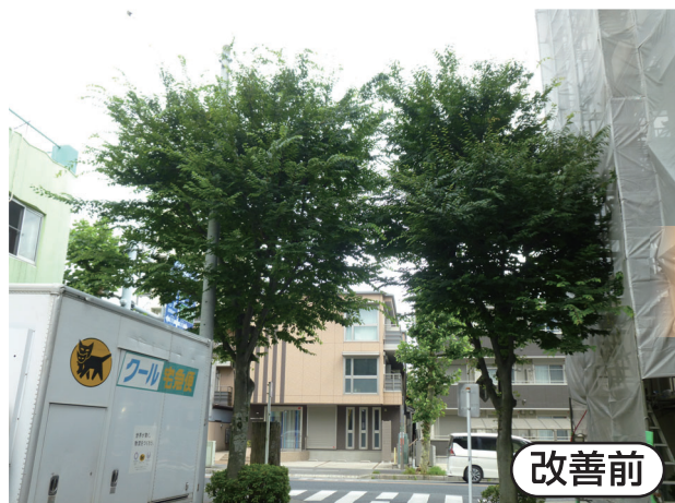
高木の伐採をおこないました。(本町1丁目うるおいの道)