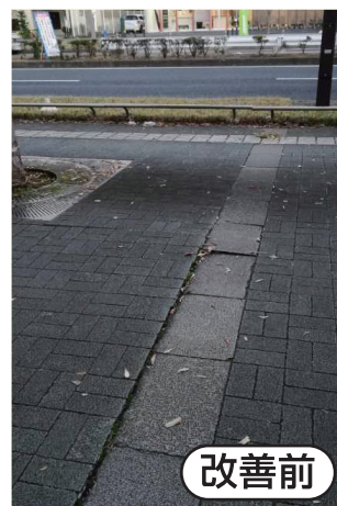
歩道の段差を改善しました。(千葉寺町)