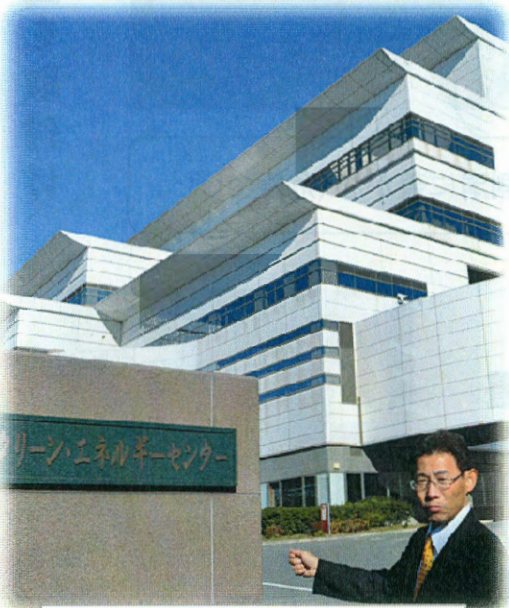
津波避難ビルに指定された、新港クリーン・エネルギーセンターにて

質問を行いました。六月定例会では「非常時の防災無線の考え方」について、九月定例会では「市民スポーツの振興」について、十二月定例会では「広域避難所・避難所・避難場所の区別や津波避難ビルの指定」について拡充の提言をいたしました。私は、引き続き大規模災害に強く、誰もが安心して暮らせる「明るく住みよいまちづくり」に向け、しっかりとしました行政対応を行ってまいります。年末筆となりまして、ご家族皆様の益々のご発展とご健勝をお祈り申し上げます。上